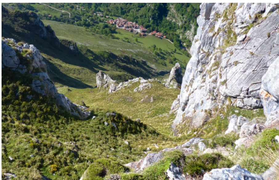
Vista del Sedo la Cruz desde el Collado la Cruz, con Tielve al fondo y El Piquín de Cotalbu asomando detrás de la roca de la derecha.

El camino vuelve a subir hasta alcanzar una llanada (1215 m) con zonas de pastos, pero mayor superficie de árgumas, que tapan bastante los senderos. Se continúa bajando suavemente para rodear una dolina (1177 m, en su punto más bajo) por su derecha y abordar la falda N del pico objetivo de esta marcha. Se trata de una caótica garma caliza de considerable pendiente, en la que el camino no se aprecia, pero de fácil intuición, siguiendo (S) unas grandes hayas salteadas por la cuesta