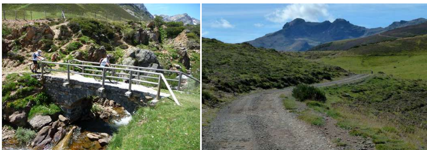
Puente para pasar el Río Frío al final de los Puertos. Vista del Curavacas desde el Collado de la Chozo de Vega la Canal.

Este collado es uno de los límites de cuencas que hay en la Cordillera Cantábrica. En su vertiente N nace un arroyo que vierte sus aguas al Río Frío que vierte sus aguas al Río Quiviesa en La Vega de Liébana y éste al Río Deva en Potes, por lo tanto, pertenece a la Vertiente Cantábrica. Sin embargo, al S del collado nace el Arroyo de Vega la Canal que vierte sus aguas al Río Carrión, que pertenece a la Cuenca Atlántica. Desde este collado, hacia el S, se ve el Pico Curavacas al alcance de la mano, ya que se encuentra a la otra parte del Valle de Pineda.