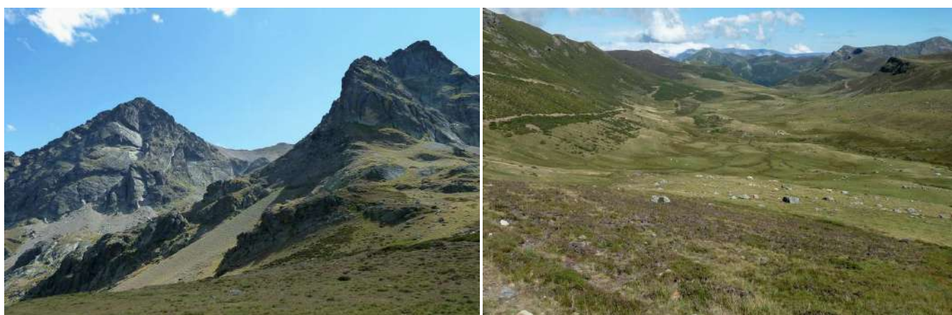
Vistas desde la falda del alto de Los Altares: Al SO el Cubil del Can y Peña Prieta (izquierda); Al E, los Puertos de Riofrío con los picos Bistruey y Lezna al fondo.

Desde el alto se baja hacia el SE, hasta alcanzar el Collado del Robadorio (2096 m) (este es el topónimo correcto, no Robadoiro, como se ve en mucha literatura, ya que la terminación "oiro" es gallega), que se ve perfectamente abajo. Una vez en este collado, se toma (SE, virando enseguida a S) el camino que rodea el alto. Éste pasa a la vertiente E del cordal y desciende para cruzar la vaguada del Río de Castrejón (2000 m), en el Valle del Cubil del Can, cerca de su cabecera. A partir de aquí el camino que se traía se convierte en una marcada pista que sube al Collado de los Cobachos (2052 m), donde se encuentra el refugio del Cubil del Can.