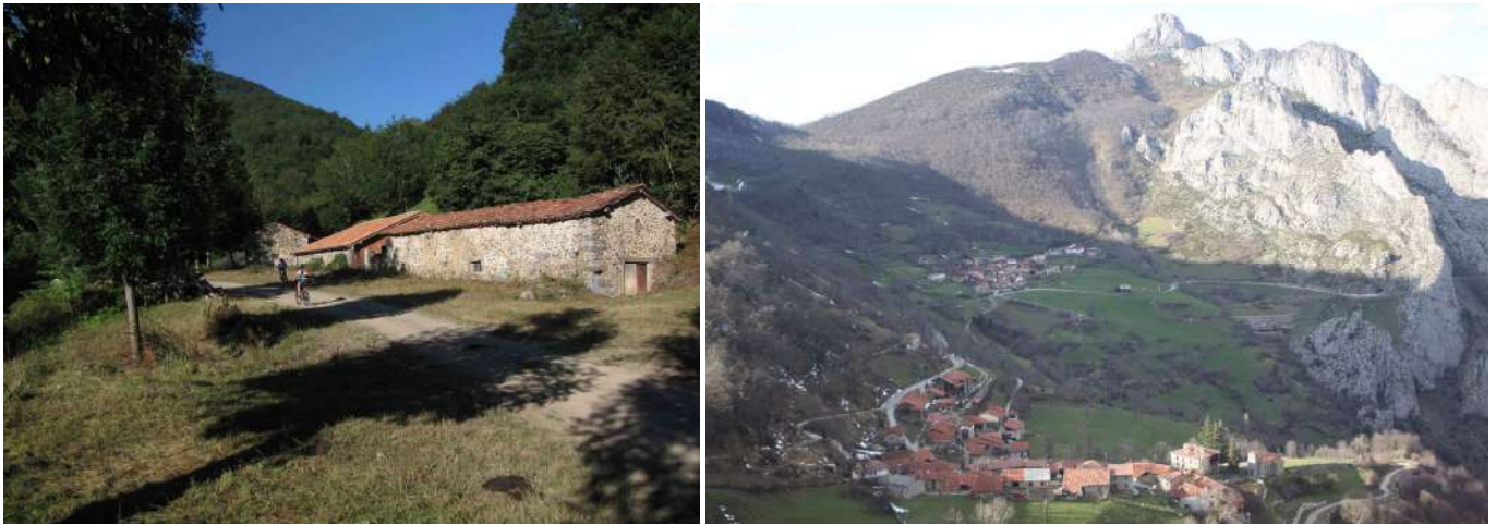
Invernales de Ranés. Cucayo (en primer término) y Dobres, bajo la Peña de la Hoz (1386 m), también conocida como Peña Dobres o Cabezo, con sus contrafuertes rocosos.

El camino deja a la izquierda los Prados de Casanzo, en cuya parte superior está el collado de Casanzo, a la vez que se pasa junto a los Invernales de La Joyaquina, que se encuentran alineados junto a la pista. A la derecha se ve el Pico Mamozán (1333 m), que muestra dos farallones, que, a modo de espinas dorsales, bajan hasta el cauce del Río Frío.