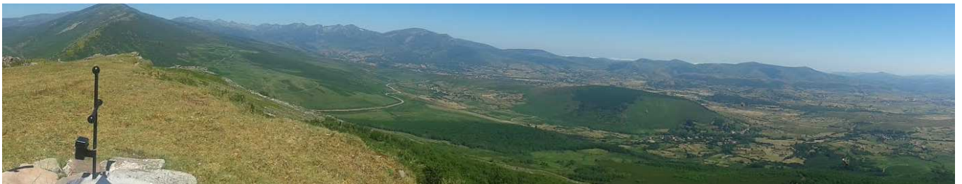
Vistas desde el Endino: A la izquierda la cumbre de Cuesta Labra (O), a continuación el Valle de Campoo de Suso (con los montes de la Sierra del Cordel y estribaciones).

Se baja al colladito denominado Peñas Manguías (1484 m). Desde este punto se puede llegar hasta la fuente de los Abedules, en diagonal por un camino de ganado (NO), pero se encuentra muy abajo, casi junto al camino de Suano al Collado de Somahoz.